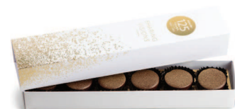
Ihre individuell gestaltete Jubiläums-Schachtel