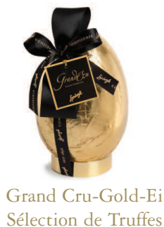
Grand Cru-Gold-Ei Sélection de Truffes