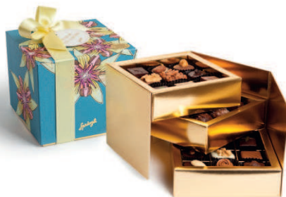
Cube in verschiedenen Sujets erhältlich