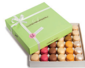
Luxemburgerli Geschenkpakete in verschiedenen Grössen