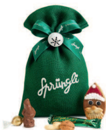
Chlaussack in zwei Grössen und Farben erhältlich