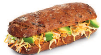
Saisonal wechselnde Sandwich-Kreationen