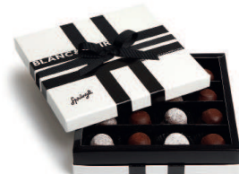
Blanc et Noir Truffes, veredelt mit feinstem Perrier Jouët Champagner