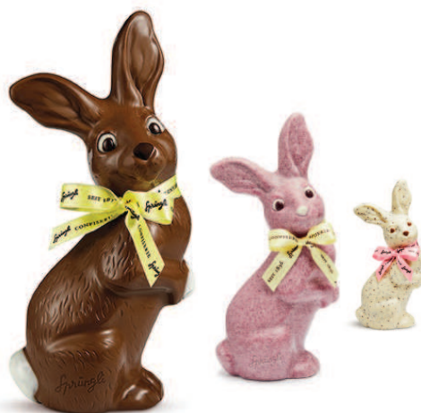
Hase Nico in bis zu vier Grössen und fünf Geschmacksrichtungen