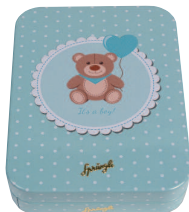
Métal-Boîte Baby Boy oder Baby Girl