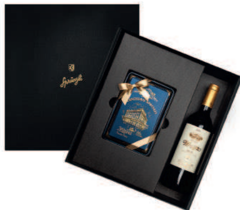
Geschenkpakete in diversen Variationen